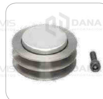
Cod. Int. RE05900020 Polea de compresor con rodamiento OF1721