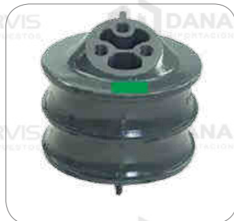
Cod. Int. RE05900023 Soporte de motor delantero