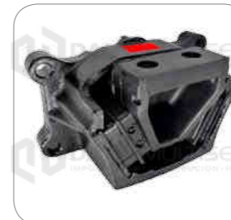
Cod. Int. RE05900048 Soporte de motor posterior (rojo) O500RSD