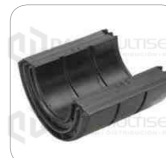
Cod. Int. RE05900037 Goma barra estabilizadora posterior 45mm O500RS