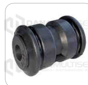
Cod. Int. RE02400042 Bocina muelle delantero (parte posterior) B270F