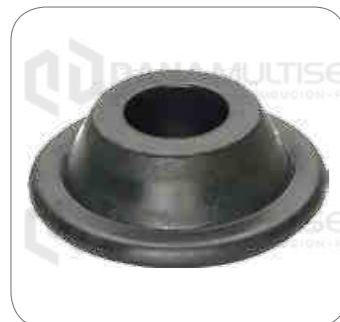
Cod. Int. RE02400037 Soporte de cabina P/G/R/T

L0915 / L0916 / OH1622 / SPRINTER / ACTROS OF1721 / OF1722 / OH1730 / 0500RSD