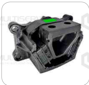
Cod. Int. RE05900022 Soporte de motor posterior AXOR