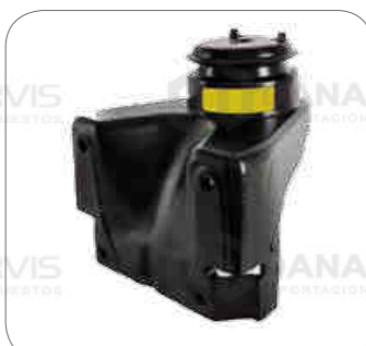
Cod. Int. RE05900053 Soporte de motor delantero O500R