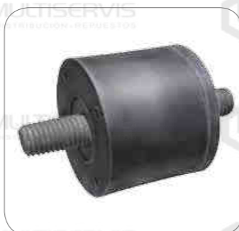
Cod. Int. RE05900017 Soporte silenciador de escape m12 B430R/B380R/B12R