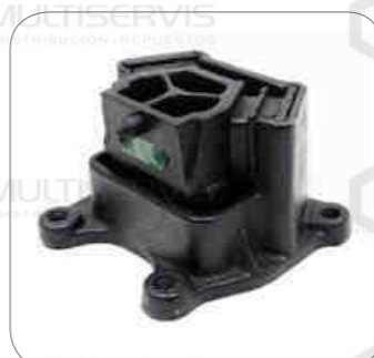
Cod. Int. RE02400085 Soporte de motor posterior izquierdo 17.260