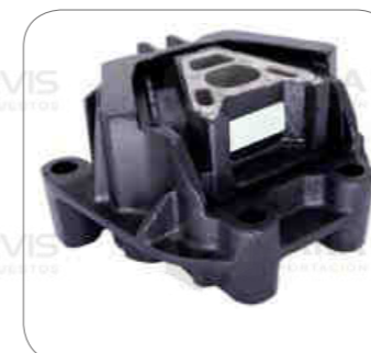
Cod. Int. RE05900026 Soporte motor posterior (blanca)