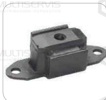
Cod. Int. RE05900010 Soporte radiador 110x48x359 x m10 S4/F/K/N/P/G/R/T