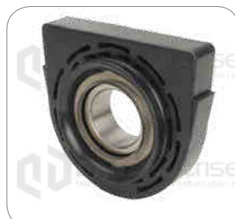
Cod. Int. RE05900034 Goma de cardan con rodamiento 45mm OF1721