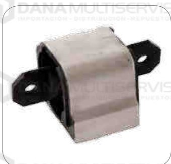
Cod. Int. RE05900043 Soporte motor posterior Sprinter