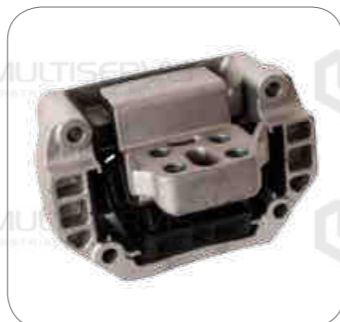
Cod. Int. RE05800004 Soporte de caja K310/K340/G340/P270/P340