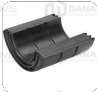
Cod. Int. RE02400077 Bocina de barra estabilizadora delantero O400RSD/O500RSD