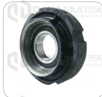
Cod. Int. RE05900032 Goma de cardan con rodamiento 60mm