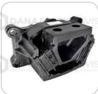
Cod. Int. RE05900039 Soporte de motor posterior con cambio OF1730