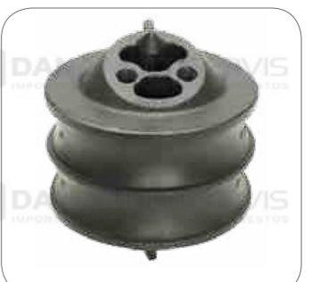
Cod. Int. RE05900002 Soporte delantero motor S4/F/K/N/P/G/R