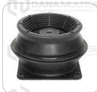
Cod. Int. RE05900009 Soporte de motor delantero/ posterior B10M