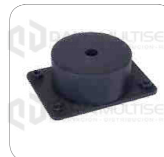
Cod. Int. RE05900042 Soporte de motor delantero inferior (arriba) B11R/B430R