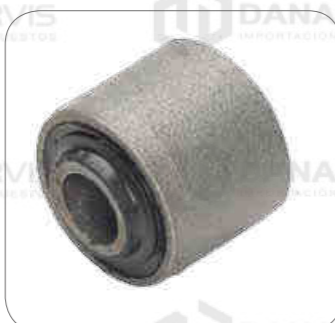
Cod. Int. RE02400029 Bocina barra estabilizadora delantero posterior L0915