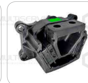
Cod. Int. RE05900029 Soporte de motor posterior O500RSD