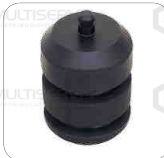
Cod. Int. RE02400064 Tope de muelle delantero L0916