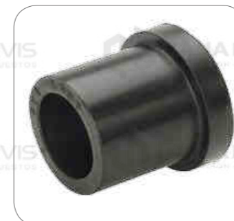
Cod. Int. RE02400018 Bocina de muelle delantero L0914 L0915