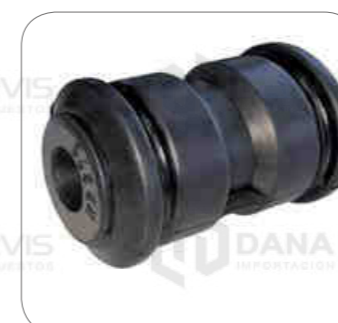
Cod. Int. RE06700004 Boina muelle posterior (parte posterior-delantero) B270