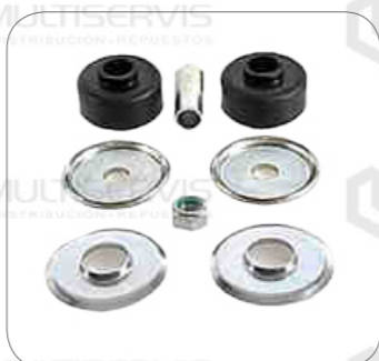
Cod. Int. RE02400028 Kit accesorios amortiguador eje loco o/p O500RSD