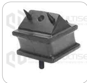
Cod. Int. RE05900016 Soporte de motor delantero 16mm