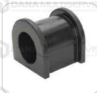
Cod. Int. RE02400035 Goma barra estabilizadora posterior 60mm FH/FM/FMX/ NH