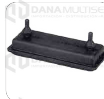
Cod. Int. RE05800006 Goma suspension de motor posterior (inferior) L0915/L0916