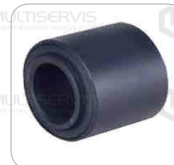
Cod. Int. RE02400033 Juego reparo barra templadora 91mm delantero posterior 3er eje B11R/B430R