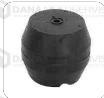
Cod. Int. RE02400007 Soporte suspension posterior k124/k410