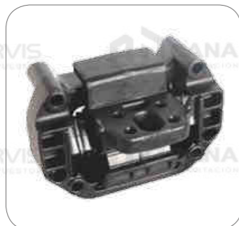
Cod. Int. RE05900040 Soporte de motor posterior m16 x2