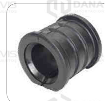
Cod. Int. RE02400083 Goma barra estabilizadora delantero/posterior B11R/B430R/B12R