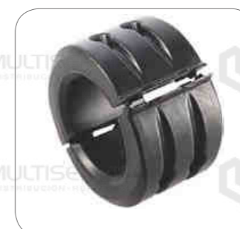
Cod. Int. RE02400039 Goma barra estabilizador posterior 64mm B380R/B310R