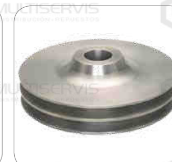
Cod. Int. RE00100003 Polea compresora de aire OF1721