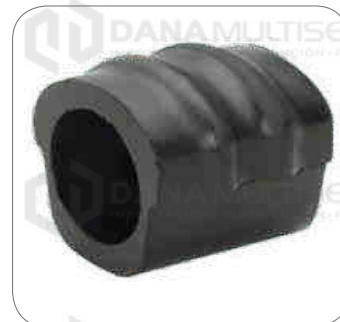
Cod. Int. RE02400012 Goma barra estabilizadora delantero L0915