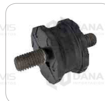
Cod. Int. RE05900047 Soporte silenciador de escape OF1730