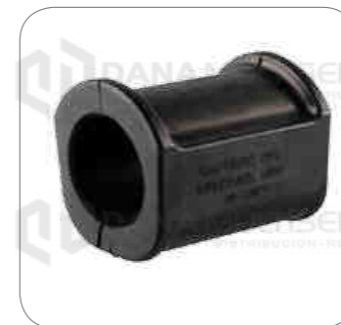
Cod. Int. RE02400067 Goma barra estabilizadora delantero 17.230