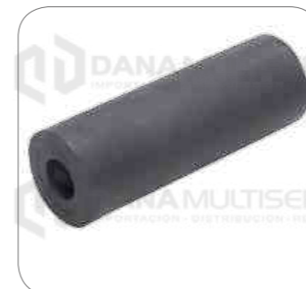
Cod. Int. RE02400017 Tubo distanciador de muelle delantero L0915