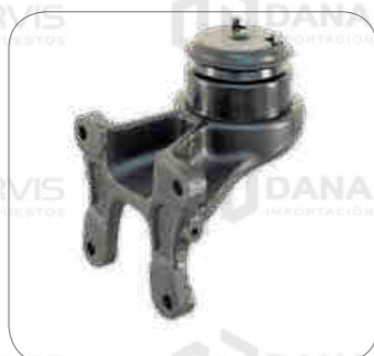
Cod. Int. RE05900024 Soporte motor delantero OF1730