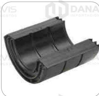
Cod. Int. RE02400027 Jebe de barra estabilizadora delantero OF1721/OH1722/OH1730