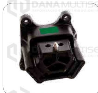
Cod. Int. RE02400084 Soporte de motor posterior derecho 17.260