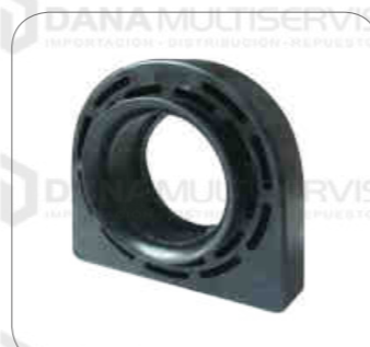
Cod. Int. RE05900036 Goma de cardan sin rodamiento 50mm Atego