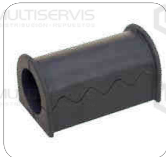
Cod. Int. RE02400021 Goma barra estabilizadora 3er eje 45mm k410/k460