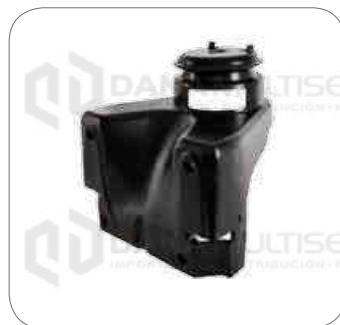
Cod. Int. RE05900038 Soporte motor delantero OF1730/ATEGO