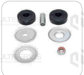
Cod. Int. RE02400032 Kit reparo amortiguador K124/K410/K380/K460