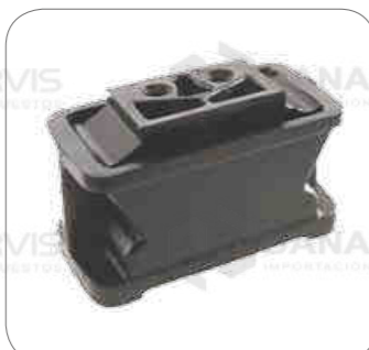
Cod. Int. RE05900004 Soporte de motor posterior lado derecho OM457LA O400