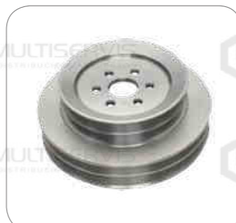
Cod. Int. RE04400003 Polea bomba de agua OF1721