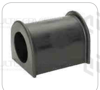
Cod. Int. RE02400004 Goma barra estab delt 49mm k124 k380