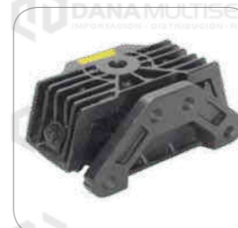
Cod. Int. RE05900007 Soporte de motor posterior OF1722/OH1622