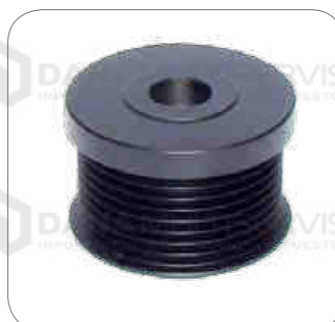
Cod. Int. RE04400001 Polea de alternador 80amp OF1722/OH1730/L0915/L0916/OH1622