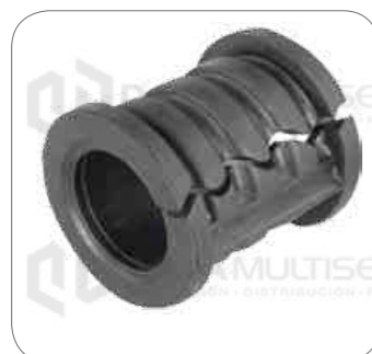
Cod. Int. RE02400044 Goma barra estabilizadora delantero/posterior B12R