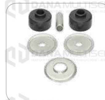
Cod. Int. RE00100005 Kit de bujes, arandelas y tubo amortiguador delt/post F112/F113/K113/I113