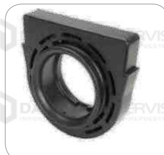
Cod. Int. RE02700003 Goma de cardan sin rodamiento 45mm OF1721