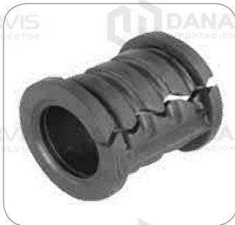
Cod. Int. RE02400019 Goma barra estabilizadora posterior 60mm B12R