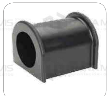
Cod. Int. RE05900008 Goma barra estabilizadora delantero 6x2 63mm k124/k94