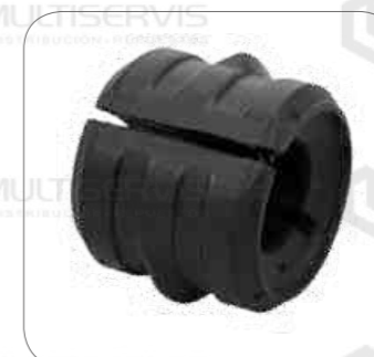
Cod. Int. RE02400033 Goma barra estabilizadora delantero 29mm FH/FM/FMX