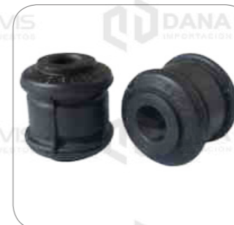
Cod. Int. RE02400024 Bocina barra estabilizadora delantero/posterior L0915