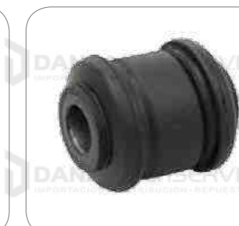
Cod. Int. RE02400014 Bocina barra estabilizadora delantero/posterior L0915