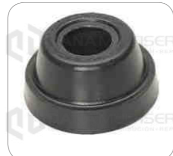
Cod. Int. RE02400023 Bocina barra estabilizadora posterior m20 P/G/R/T/F/K/N