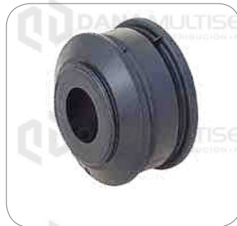
Cod. Int. RE02400041 Bocina barra estabilizadora delantero 41mm B270F