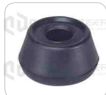
Cod. Int. RE02400002 Bocina barra estabilizadora posterior k124/k310/k380/k400/k410/k440/k460