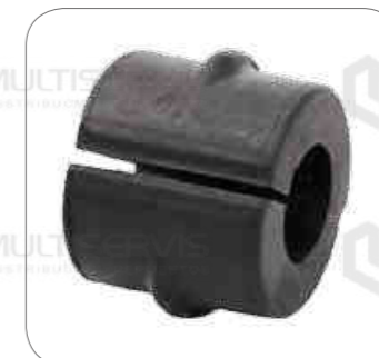
Cod. Int. RE06700001 Goma barra estabilizadora delantero/posterior L0916