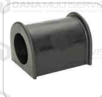
Cod. Int. RE02400005 Goma barra estabilizadora 47mm posterior k124/k410