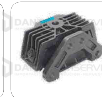
Cod. Int. RE05900045 Soporte de motor posterior OF1722/OH1622