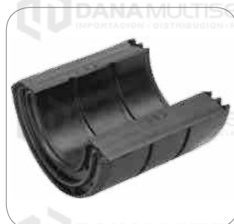
Cod. Int. RE02400006 Goma barra estabilizadora delantero O500RSD