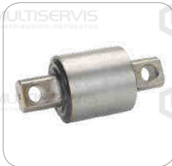
Cod. Int. RE02400010 Bocina barra estabilizadora