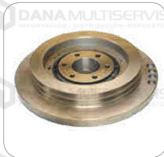
Cod. Int. RE02400003 Bocina de barra estabilizadora delantero/posterior B7/B10/ B12/B58