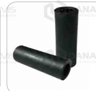
Cod. Int. RE02400025 Tubo distanciador de muelle posterior L0914/L0915