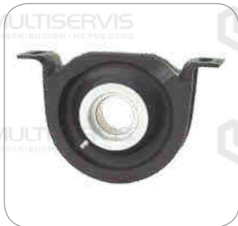
Cod. Int. RE02400040 Soporte de cardan con regulador 45mm Sprinter