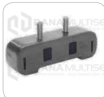
Cod. Int. RE02400030 Soporte radiador con pernos L0915