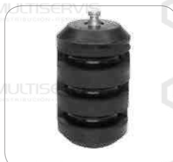
Cod. Int. RE05900021 Soporte goma barra estabilizadora delantero (tope muelle) L0915