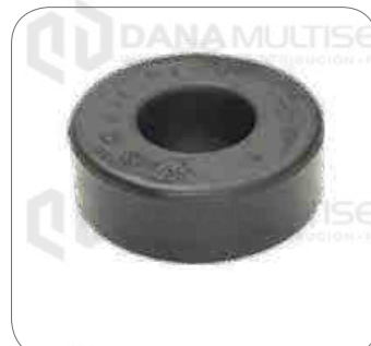
Cod. Int. RE02400001 Bocina barra estabilizadora delantero/posterior O400/ O355/O364/O370