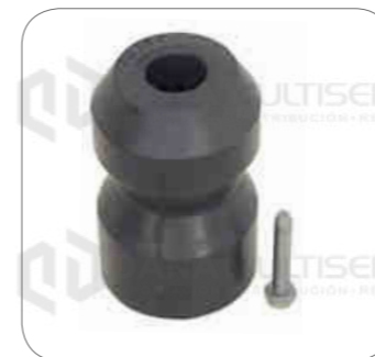
Cod. Int. RE02400057 Goma suspension muelle delantero 10.160