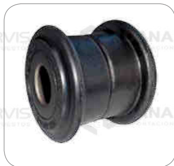
Cod. Int. RE02400026 Bocina barra estabilizadora delantero/posterior L0915/L0914