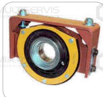
Cod. Int. RE02700004 Soporte cardan OF1721