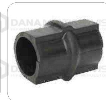
Cod. Int. RE00100002 Goma barra estabilizadora posterior L0914/L0915

KITS DE REPAROS/BUJES/COJINETES BOCINAS/SOPORTES/GOMAS/TOPES