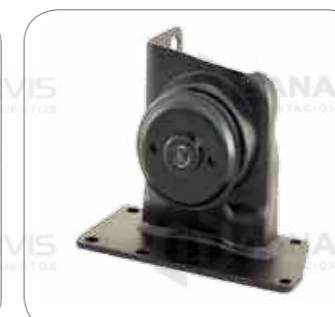
Cod. Int. RE05900012 Soporte de motor delantero derecho L0915