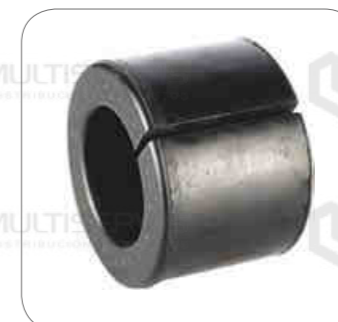
Cod. Int. RE06700006 Goma barra estabilizadora delantero 41mm B270F