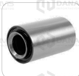
Cod. Int. RE02400069 Bocina muelle posterior 9.15