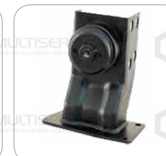
Cod. Int. RE05900011 Soporte de motor delantero izquierdo L0915