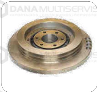
Cod. Int. RE05900015 Antivibrador (polea de damper)