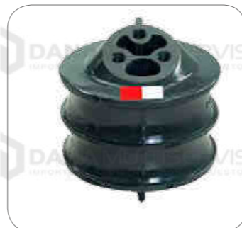
Cod. Int. RE05900025 Soporte motor delantero