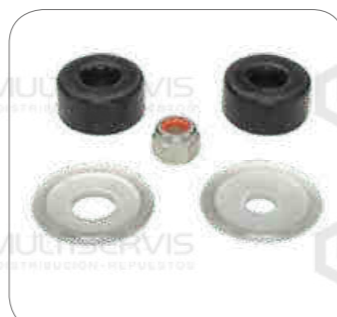
Cod. Int. RE02400011 Kit accesorios amortiguador O500RSD/O500R