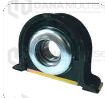
Cod. Int. RE02400022 Soporte de cardan (completo) 45mm OF1721/L0915/L0916