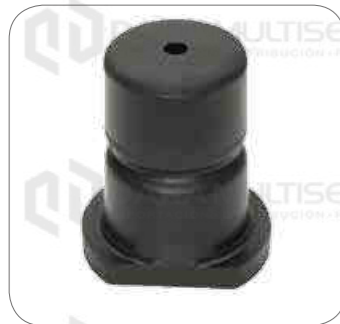
Cod. Int. RE02400052 Tope del resorte delantero OF1721/OF1722