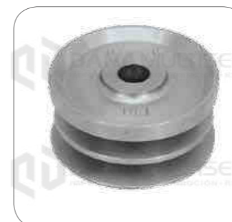
Cod. Int. RE04400004 Polea de alternador 80amp OF1721