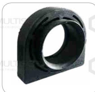
Cod. Int. RE05900035 Goma de cardan sin rodamiento 40mm L0914