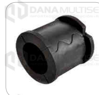
Cod. Int. RE00100006 Goma barra estabilizadora posterior B270F