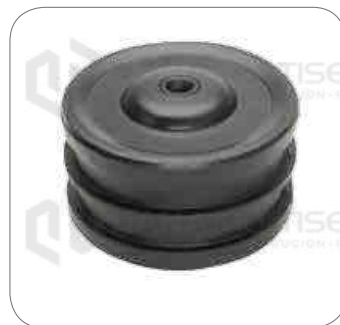
Cod. Int. RE05900003 Soporte de motor delantero 12mm