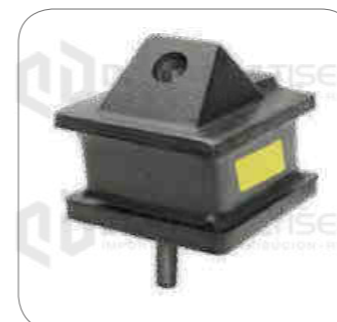
Cod. Int. RE05900014 Soporte de motor delantero OF1721/O500RSD/O500RS