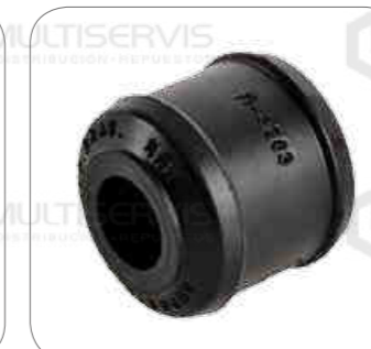
Cod. Int. RE06700002 Bocina barra estabilizadora delantero/posterior L0916