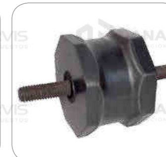
Cod. Int. RE02400015 Soporte de tanque de aire tubo de escape O500