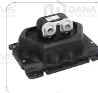
Cod. Int. RE02400031 Soporte de motor posterior FH/FM/FMX/NH