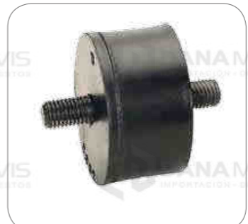
Cod. Int. RE05900018 Soporte radiador F112/F113/K112