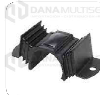
Cod. Int. RE05800002 Goma suspension de motor posterior (superior) L0915