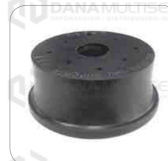
Cod. Int. RE02400034 Goma suspension de motor delantero FH /FM