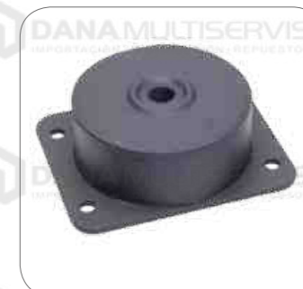
Cod. Int. RE02400051 Soporte de motor delantero inferior (abajo) B11R/B430R