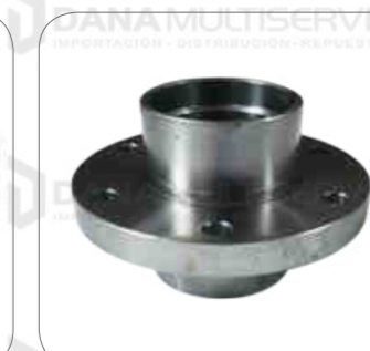
Cod. Int. RE05900013 Cubo de ventilador O500RSD