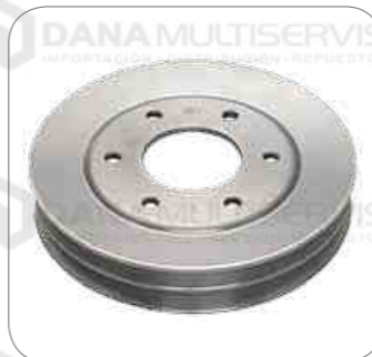
Cod. Int. RE05900030 Polea ventilador intermedia (grande) 0500RSD/OH1521