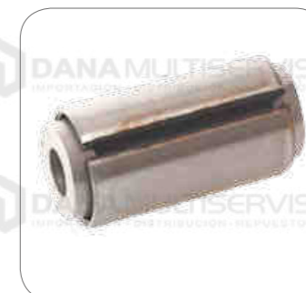
Cod. Int. RE02400036 Buje de ojo de resorte del eje de suspensión FH/FH12