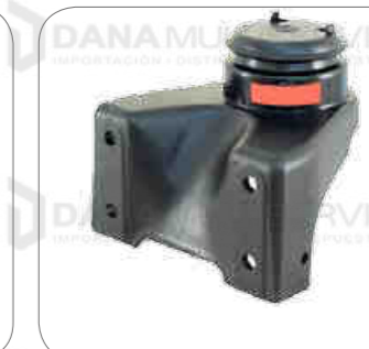
Cod. Int. RE05900044 Soporte de motor delantero L1622/L1625/OH1518/OH1521 O500R/OF1519