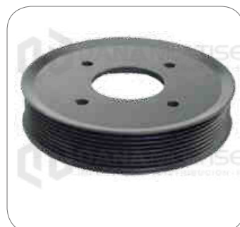
Cod. Int. RE04400002 Polea bomba de agua L0915/L0916/OH1722/OH1730/O500R