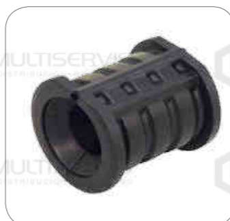
Cod. Int. RE02400067 Goma barra estabilizador 3er eje b11r b430r