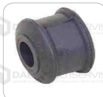
Cod. Int. RE02400038 Goma barra estabilizadora posterior Sprinter