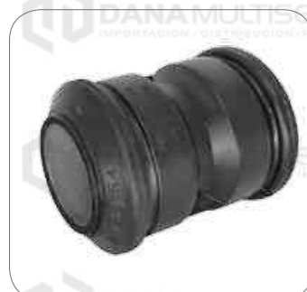
Cod. Int. RE02400016 Bocina muelle delantero posterior L0915 (58.5mmx36.2mmx86.5 mm)