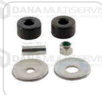
Cod. Int. RE00100004 Kit accesorios amortiguador O500RSD