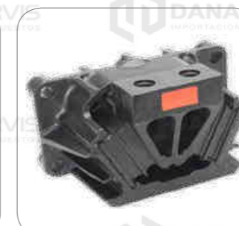
Cod. Int. RE05800005 Soporte de motor posterior (caja cambio) O500RSD