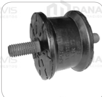
Cod. Int. RE05900001 Soporte silenciador escape O500RSD/OF1721/O500R