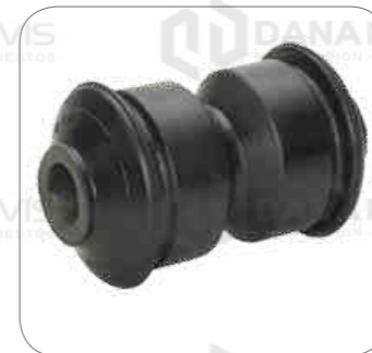
Cod. Int. RE02400068 Bocina de muelle delantero 9.150/8 8.140