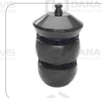
Cod. Int. RE05900019 Soporte goma barra estabilizadora posterior (tope muelle) L0915