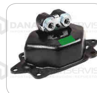
Cod. Int. RE05800003 Soporte de motor posterior B11R/B430R