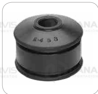
Cod. Int. RE00100001 Bocina barra estabilizadora delantero posterior OF1721/OF1726/OF1730