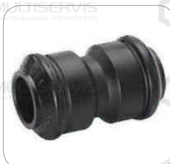
Cod. Int. RE02400020 Bocina muelle delantero posterior L0915 (52mmx30.20mmx86.5mm)