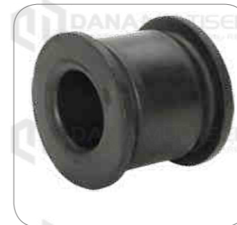
Cod. Int. RE02400063 Goma barra estabilizadora posterior 10.160