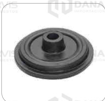
Cod. Int. RE05900005 Tope goma de motor con intercooler B10M/B58