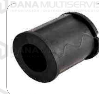
Cod. Int. RE02400056 Goma grillete superior posterior B270F