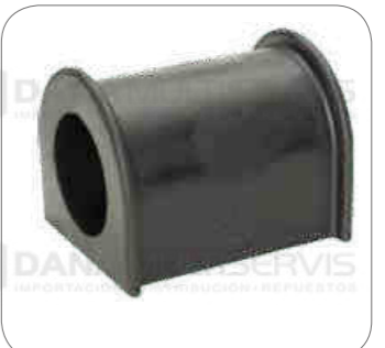
Cod. Int. RE02400009 Goma barra estabilizadora 60mm (delantero) k360