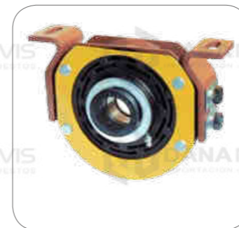
Cod. Int. RE02700009 Soporte de cardan (completo) 45mm 10.160