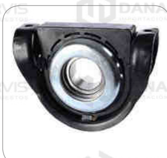
Cod. Int. RE02700008 Soporte de cardan (completo) 60mm OF1730