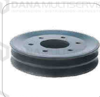
Cod. Int. RE05900027 Polea ventilador intermedia (pequeña) 0500RSD