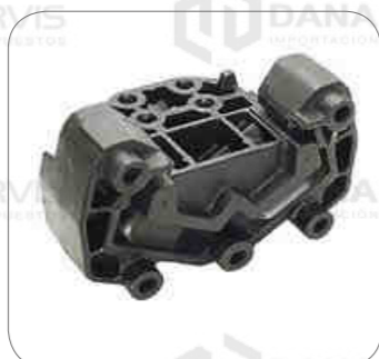
Cod. Int. RE05900006 Soporte caja de cambio (reforzado) S4