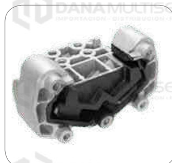
Cod. Int. RE05800007 Soporte caja de cambio s4