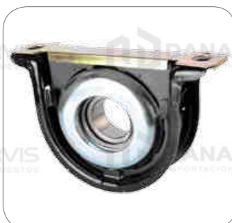
Cod. Int. RE05900033 Soporte de cardan (completo) 40mm L0914