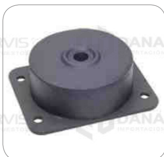
Cod. Int. RE05900041 Soporte de motor delantero inferior (abajo) b11r b430r