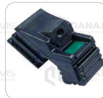
Cod. Int. RE02400083 Soporte de motor delantero 17.260