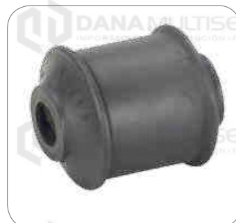
Cod. Int. RE02400072 Bocina barra estabilizadora delantero ojo toro 17.210 18.310