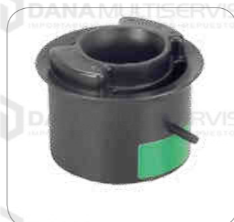
Cod. Int. RE05900052 Asiento de motor posterior 13.150