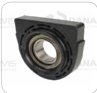
Cod. Int. RE02700006 Goma de cardan con rodamiento 50mm B270F