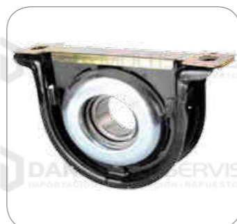
Cod. Int. RE02700005 Soporte de cardan (completo) 50mm b270f