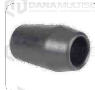
Cod. Int. RE02400013 Bocina barra estabilizadora posterior O400